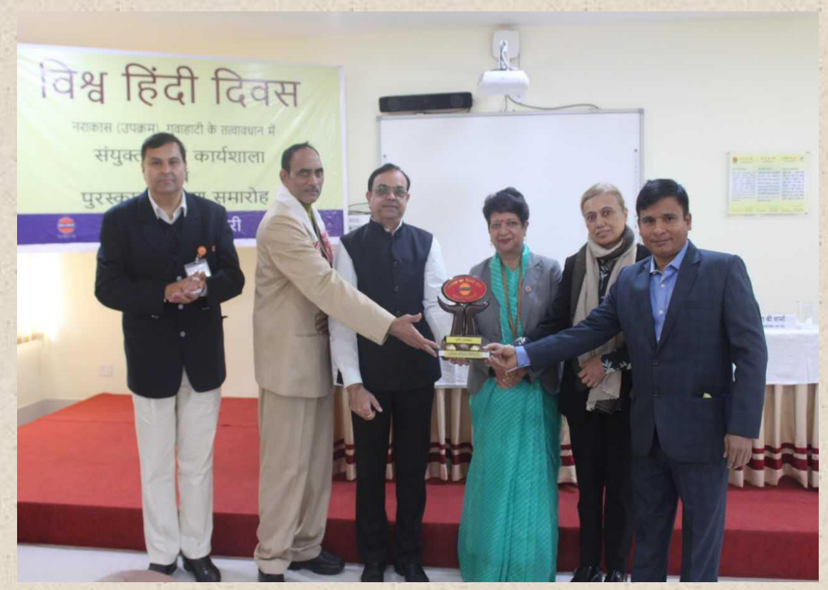
15. ऑयल इंडिया लिमिटेड कोलकाता कार्यालय को वर्ष 2019-20 के लिए प्रथम राजभाषा शील्ड, नगर राजभाषा कार्यान्वयन समिति की ओर से प्रदत्त प्रथम राजभाषा शील्ड