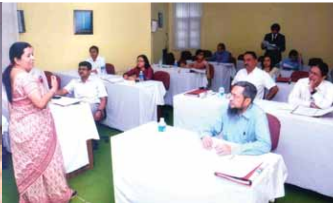
Training on ROI by Exponential Advisory from 17 th to 19 th April 2014