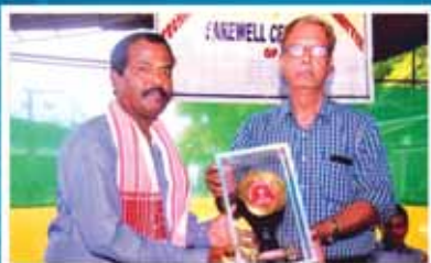
শ্রী সজন পুৰকায়স্থ টি এছ ড্ৰিলিং বিভাগ