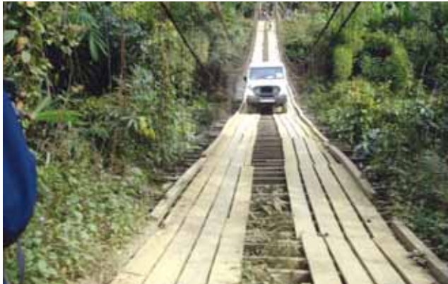
Suspension Bridge over river Tlawng- Mizoram– Now replaced by a steel bridge