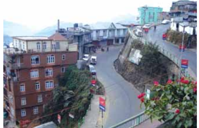
Entry to Aizawl - No scope to widen roads