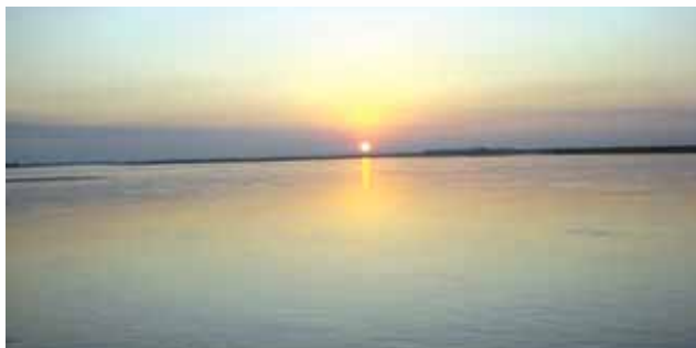
Crossing mighty Brahmaputra – one of the options to reach Sadia block

Another important thing which required to be considered is the timing. The survey is possible in hilly or mountainous area only in dry days. As such other activities should be accordingly arranged so that there is proper correlation between them. In most of the areas in north east India, civil engineering work, mainly the earth work, is kept suspended during rainy days (April to September) due to inclement weather. It has to be remembered that heavy earth work is involved while constructing roads and well sites particularly in hilly areas. The plan for disposal of cut earth should also be done well in advance. Regarding construction of bridges, road alignment should be planned in such a way that bridges are avoided to the extent possible as construction of bridges (except Bailey Bridges) take very long time and consume huge amount of resources including money. Availability of construction material and water in another important factor which should be surveyed and determined at the early stage of the project.