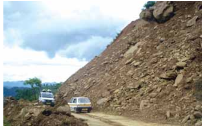
Road cleared after landslide in Mizoram