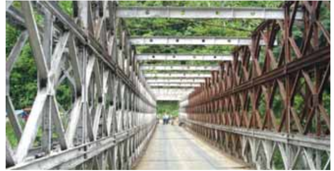
Baley Bridge in Mizoram with top restriction