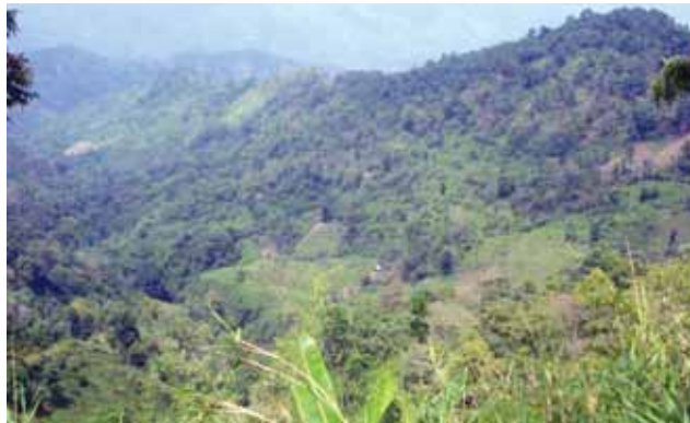
Proposed Well site – Loc 2 Mizoram