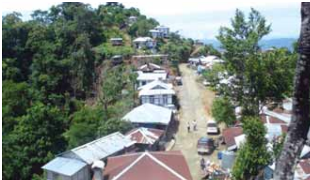
Ribbon Development in Mizoram