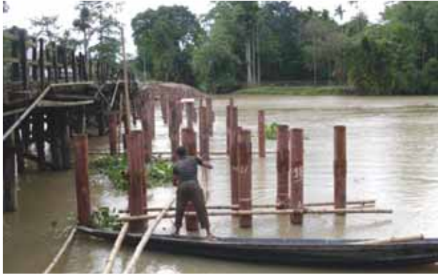
75 m long bridge over river Sessa when under construction – Dibrugarh block