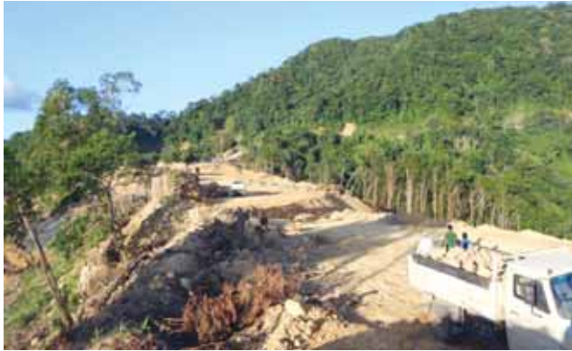
Loc MZ-3 under construction