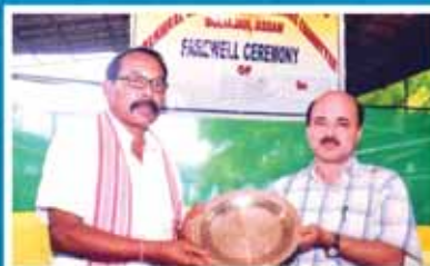
শ্রী ৰমা গগৈ টি এছ ড্ৰিলিং বিভাগ