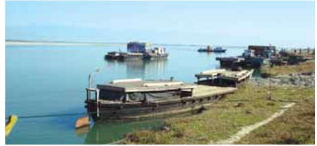
Crossing River Brahmaputra at Dhola - Sadia Block