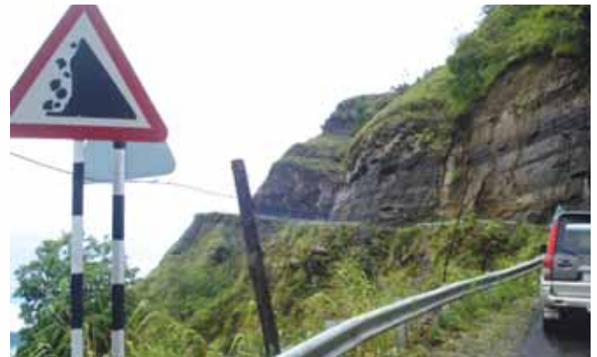
Sharp and steep curve in Mizoram