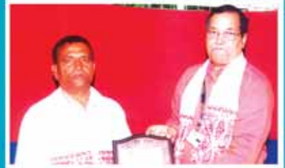
মঃ গফৰ পৰিবহন বিভাগ