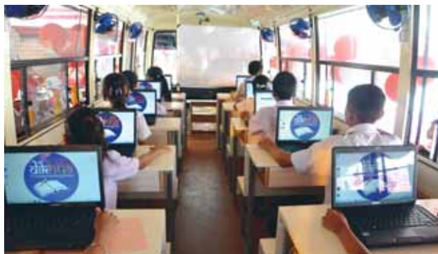
School children inside the computer bus

In year 2014 the computer bus will impart education to students of class VI, VII and VIII in 12 schools within OIL's operational areas in Tinsukia, Dibrugarh and Sivasagar Districts (4 schools in each District). The project will reach out to more schools in coming years. Baseline survey for two projects Computer education programme and adult literacy was conducted to assess the ground situation based on which the long term