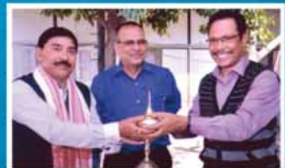
শ্রী এছ আৰ গায়ন সুৰক্ষা (নিৰাপত্তা) বিভাগ