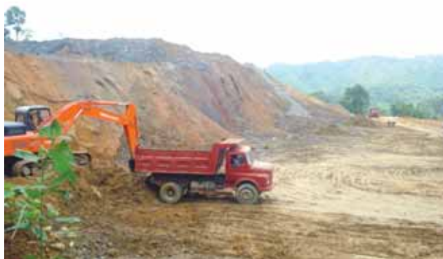
Constructing well site- Loc 8 Mizoram_ Earth work -2.50 lakh Cum