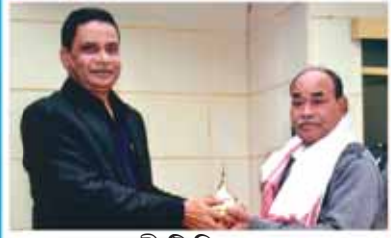
শ্রী টি চি বৰা খনন বিভাগ