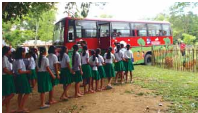
Children queuing up for the computer class

Education, OIL will incur an expenditure of ₹ 115 lakhs which includes procurement of 50 nos. of K-Yan. Under Project 'OIL Dikhya', training to 150 teachers from 75 primary schools of OIL's operational areas shall also be imparted. OIL will invest around ₹ 15 lakhs for the project.