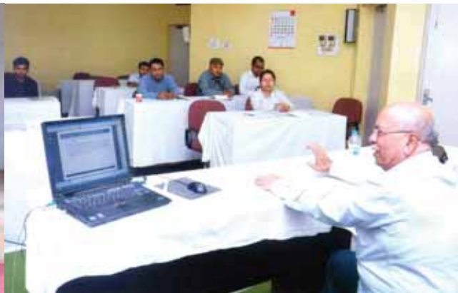
Training on Hazop Study by National Safety Council Mumbai from 26 th to 28 th March 2014