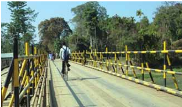
Bridge over river Sessa after completion