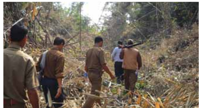
People have to walk miles together to reach the demarcated site

3.0 Acquisition of land is one of the most important aspects for any project. For hydrocarbon exploration projects land is normally required for construction of new road, well site, camp site, storage area and for widening of existing roads. For NELP blocks, the land is being procured as outright purchase either through mutual agreement with the land owners or acquisition under LA Act. In most of the plain areas the land records are readily available and therefore it becomes easy to negotiate with the land owners. However in states like Mizoram and few districts in Assam like the Dima Hasao, where the village council/ rural bodies are much powerful, the ownership of the land is a complicated subject and still lies with these bodies. As such, in such places intervention from Govt. machinery is always preferable for acquisition of land. All rules and regulations and local land laws must be studied beforehand. Some of the temporary requirements of land for campsite, store yard, etc. should be taken on lease with payment of development cost. This reduces the hardship of land acquisition process.