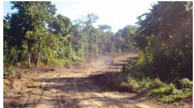
9.0 km long Road to Loc KA1 in Dima Haso district under construction