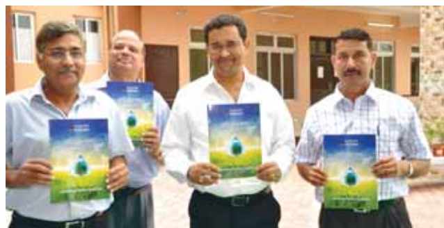
Release of brochure on Environment Management in OIL

held in OIL H.S. School, Duliajan aimed to create awareness among the young minds on the importance of protecting the planet. Around 230 number of children from class IV th to XII th from various schools in and around Duliajan participated in this event.