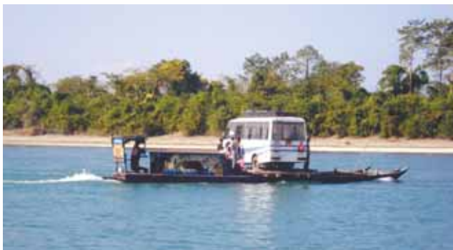
Crossing river Lohit at Alubari- Sadia block Alternate Route