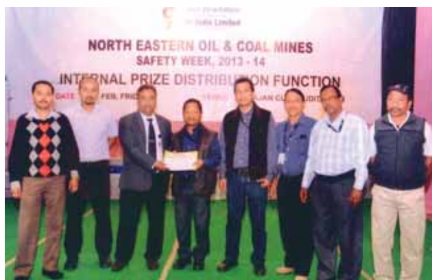
Award presented during prize distribution ceremony

accident free workmen, best installations in each category of competition (Drilling, Workover Rigs Old OCS, New OCS, Workshops, Mud plants, GCS, Materials Godown, Power House, EPS, QPS, CTFs etc.), best departmental performance on safety etc. Also, the two best departments that reported maximum near miss incidents were awarded.