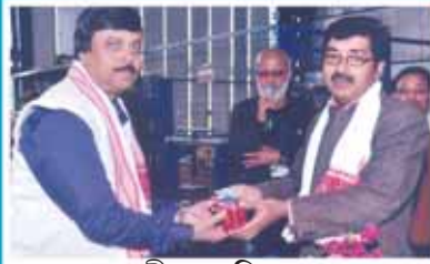
শ্রী আৰ. চি. নাথ পৰিবহন বিভাগ