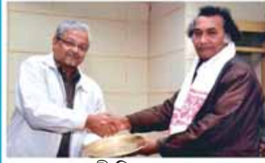
শ্রী পি বৰুৱা খনন বিভাগ