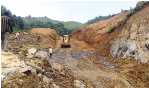
Loc MZ-8 approach under construction