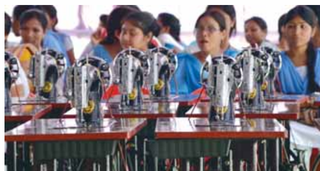
Sewing machine provided to trainees as post training assistance

are imparted free training in cutting, knitting, embroidery and weaving in this centre along with a monthly stipend. Three decades ago OIL took initiative to imbibe sense of self sufficiency among rural women folk and is still pursuing it with same zeal and enthusiasm. Till date more than 900 women completed training from this institute.