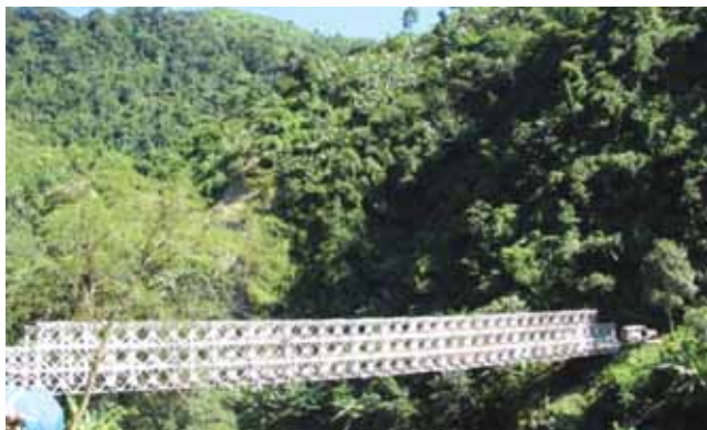
Bailey bridge on the link road - Mizoram