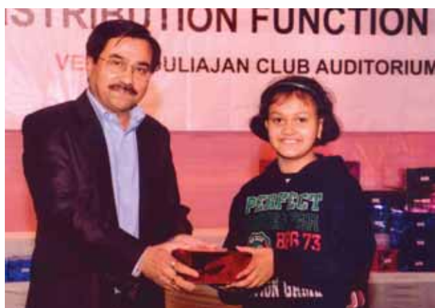
Award presented to a participant

accident free workmen, best installations in each category of competition (Drilling, Workover Rigs Old OCS, New OCS, Workshops, Mud plants, GCS, Materials Godown, Power House, EPS, QPS, CTFs etc.), best departmental performance on safety etc. Also, the two best departments that reported maximum near miss incidents were awarded.