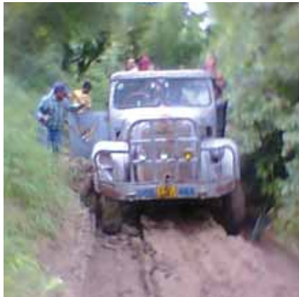
Existing road to KA-1 in Dima Hasao Dist