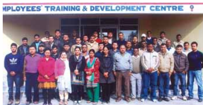
MVT training to the employees by Internal Faculties