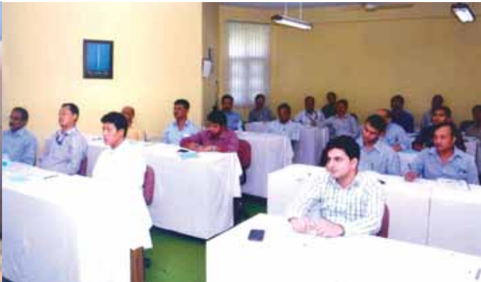
Training on how to communicate with hostile society by Australian Institute of Management on 16 th May 2014