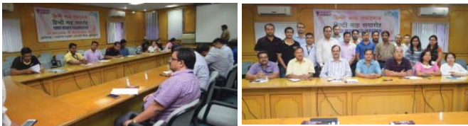
हिन्दी माह 2016 की शुरुआत निबंध लेखन प्रतियोगिता के साथ की गई, निबंध लेखन प्रतियोगिता में भाग लेते हुए प्रतिभागी गण।