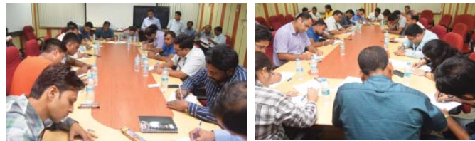
हिन्दी डिक्टेसन (श्रुतिलेखन) की प्रतियोगिता में भाग लेते हुए प्रतिभागीगण।