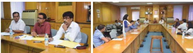
पूरे माह के दौरान हिन्दी की अनेक रचनात्मक प्रतियोगिताओं का आयोजन किया गया। वाद-विवाद प्रतियोगिता में उपस्थित निर्णायक गण एवं अपना-अपना पक्ष रखते हुए प्रतिभागी