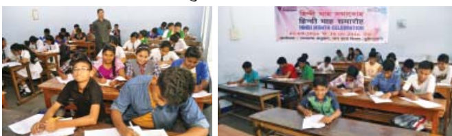
हिन्दी माह के दौरान दुलियाजान एवं आस-पास के विद्यार्थियों के लिए हिन्दी भाषा ज्ञान की प्रतियोगिता का आयोजन किया गया था। इस प्रतियोगिता में भाग लेते विभिन्न विद्यालयों के विद्यार्थी।