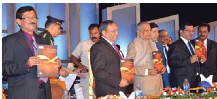
Release of Souvenir to mark the occasion