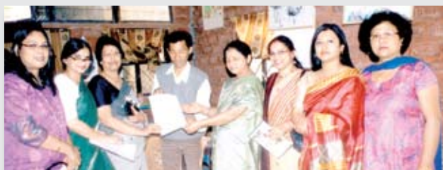
Ladies Club of Narangi handing over cheque to Parijat Academy