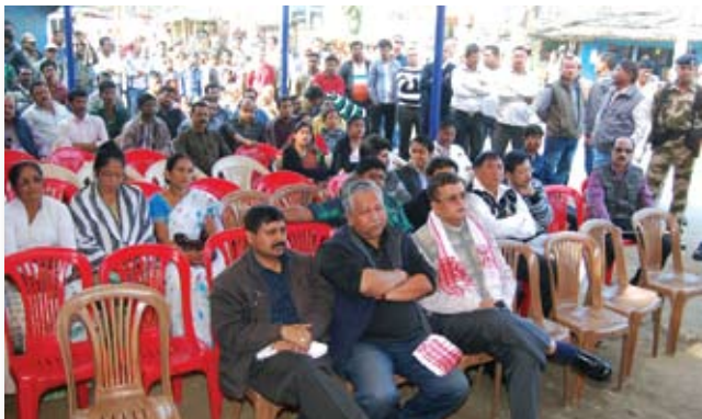
Audience attending the foundation stone laying ceremony

This major investment by OIL for the double lane road with both side drainage system along with street light facilities once completed will be of immense help to the common public as Several Educational Institutes, residential areas etc are located by the side of the road. Being the most important connectivity to Dibrugarh and other parts of the State, this road passes through the heart of Duliajan Town having commercial & marketing complexes, Registered Office and Industrial Area of Oil India Limited, Head Quarter of Assam Gas Company, etc.