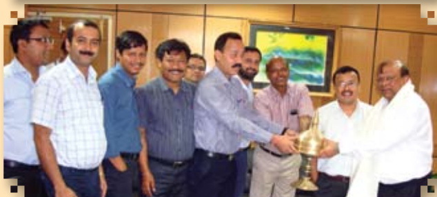
Farewell to RCE by OIEEA