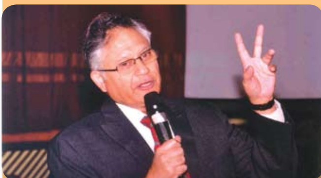
Training on 'Optimize your performance and move up to the next level' by motivational speaker Mr Shiv Khera at MTDC from 3 rd to 5 th December 2012