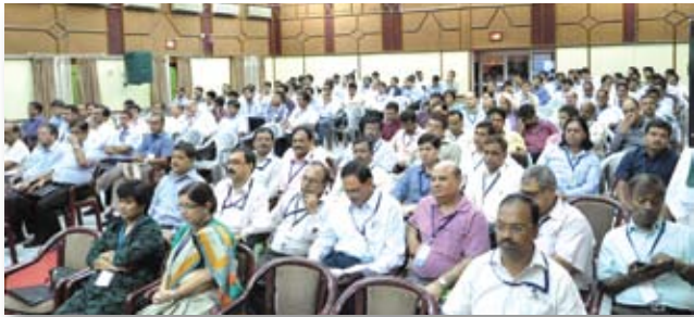
सम्मेलन में प्रतिभागीगण भाग लेते हुए