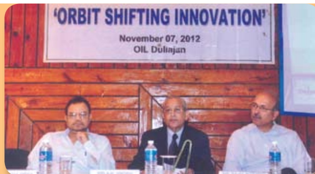
Workshop on Orbit Shifting Innovation on 7 th November, 2012 at MTDC Duliajan conducted by Petrofed