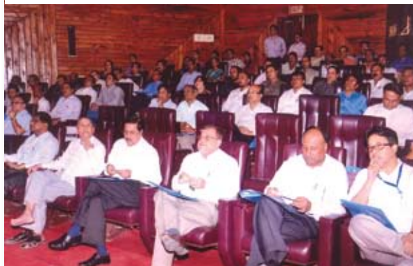
OIL officials attending seminar at MTDC