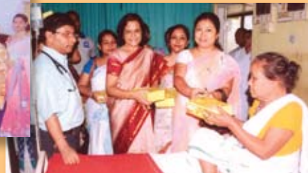
Distribution of fruits by Hansapung Ladies Club to patients of Civil Hospital Digboi during Independence Day