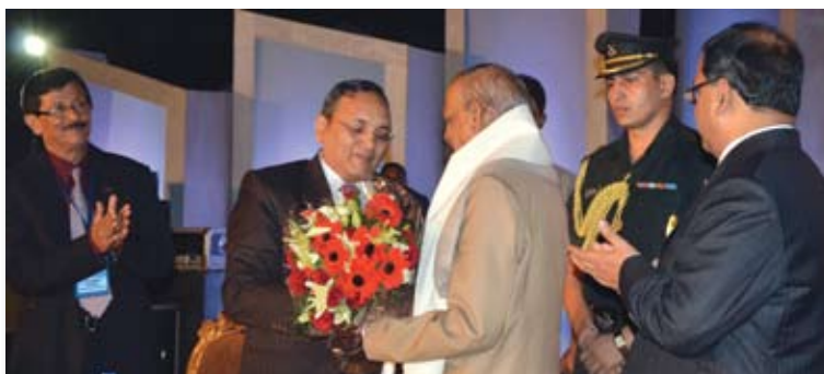
Shri S K Srivastava, CMD, OIL felicitating Shri J B Patnaik, Governor of Assam

Attributing the success of Oil India Pipeline to the hard work and sincere efforts put in by all its personnel, the Governor wished it a glorious future ahead.