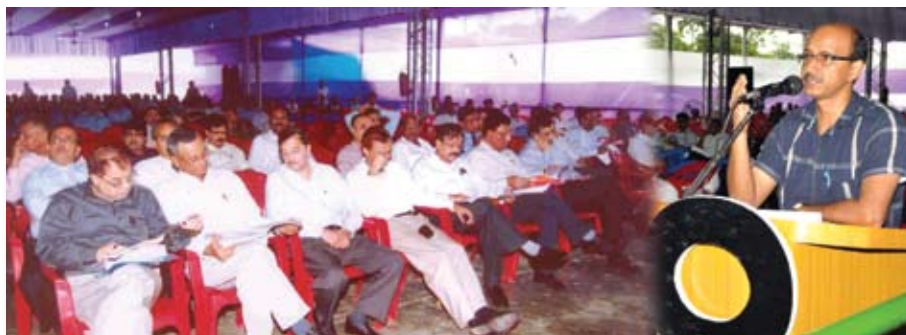
Shareholders attending the 53 rd Annual General Meeting of OIL at Bihutoli

The CMD mentioning about OIL's pipeline transportation business said that all the three segments of pipeline operations ensured uninterrupted throughput, achieving a throughput of 99.57% of the off-take in 2012 against 99.5% in 2011. The crude off-take at 6.740 MMT was 11.15%