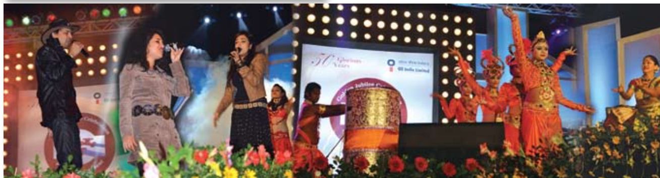
Glimpses of Cultural programme on the occasion