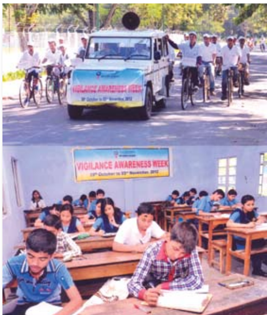
Children participating in the slogan writing competition