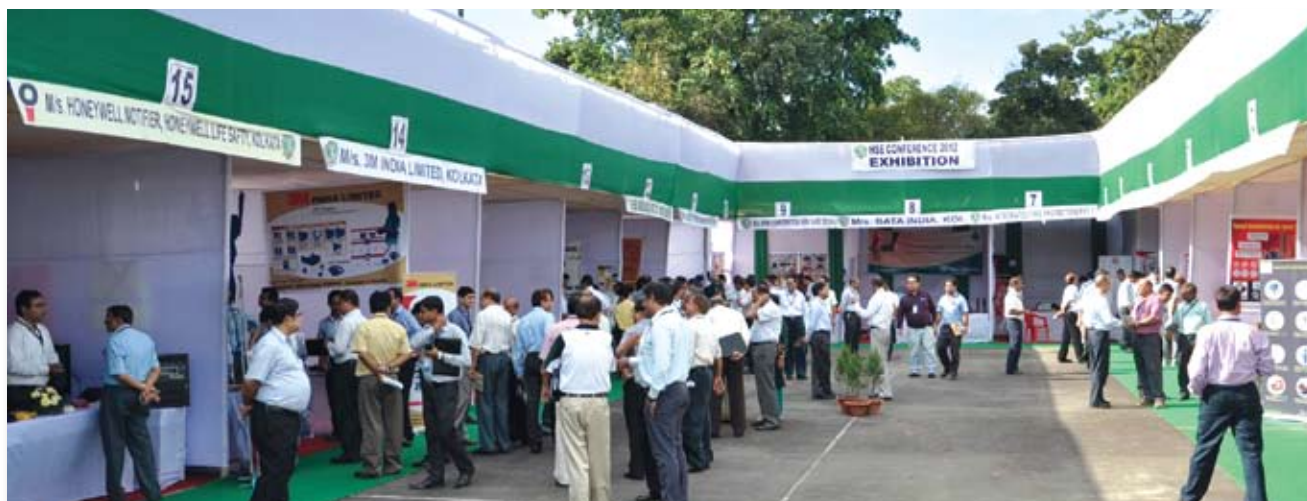
Exhibition venue at Zaloni Club

The 2012 National Level Conference on HSE which is first of its kind hosted by Oil India Limited featured an extensive and comprehensive technical programme and the participation of domain experts from E&P and HSE sector and technical and knowledge sharing sessions made the two days event