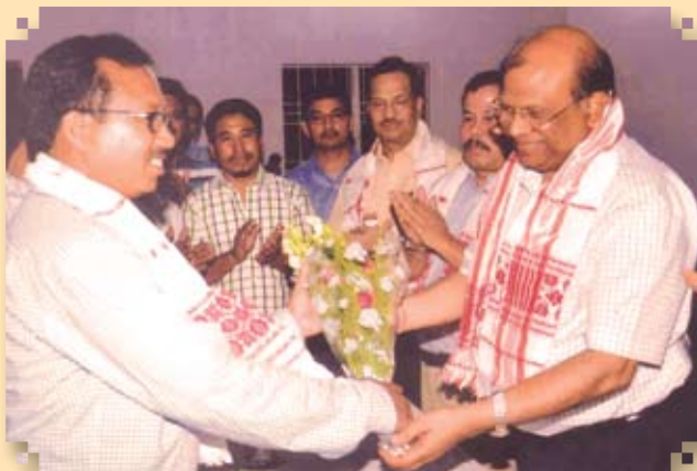
Farewell to RCE by IOWU