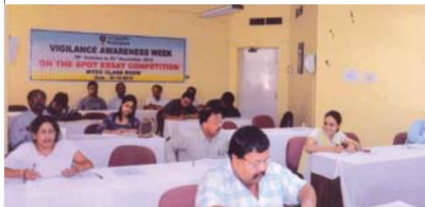
Active participation in on the spot essay competition