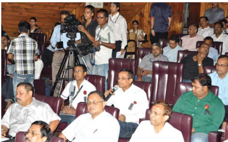
प्रेस मीट में मीडिया के लोग भाग लेते हुए

अध्यक्ष एवं प्रबंध निदेशक ने जानकारी दी कि ऑयल द्वारा असम में तेल एवं गैस की 7 नई खोज की गई। 31 मार्च 2012 को कंपनी का तेल और गैस भंडार काफी सुदृढ़ रहा। 31 मार्च 2012 को कंपनी का 2पी भंडार करीब 1.5 बिलियन बैरल तेल + गैस के समतुल्य तेल था। इन खोजों से एक नया विकल्प सामने आया है जो महत्वपूर्ण विकास संभावनाओं को परिलक्षित करता है। ऑयल द्वारा वर्ष 2011-12 में 52020 मेट्रिक टन एलपीजी का उत्पादन किया गया जो वर्ष 2010-11 से 15.57 प्रतिशत अधिक है।