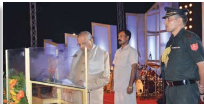
Shri J B Patnaik, Governor of Assam delivering the presiding speech