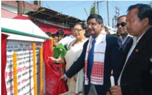
Shri K K Nath, RCE, OIL along with Ms. Amiya Gogoi, Local MLA unveiling the foundation stone

Oil India Limited had signed Memorandum of Understanding (MoU) with the Assam Public Works Department (APWD), Govt of Assam on 10 th September, 2012 for execution and completion of Upgradation of 4.60 kms road of Duliajan town (from Duliajan Rly. Gate to Tipling Tiniali Road) for an amount of ₹ 24.32 crores (Twenty four crores and thirty two lakhs).