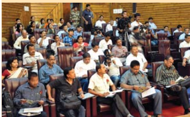
Media personnel attending the Press Meet