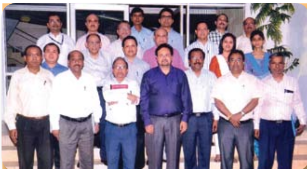
Workshop on Timeless Leadership conducted by IIM Kozhikode from 1 st to 3 rd of November 2012 at MTDC Duliajan