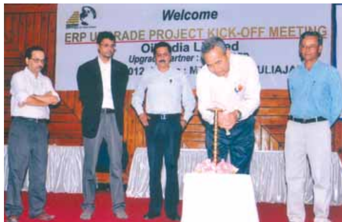
ERP Upgrade Project Kick Off Meeting on 1st June, 2012 at MTDC, Duliajan