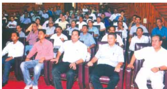
A Program on "Inauguration of Institute of Well Control Technology" held on 18th June, 2012 at MTDC, Duliajan