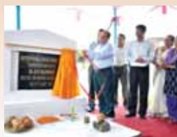
Page - 4