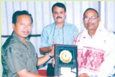
শ্ৰীমদন হাঞ্চ, উৎপাদন (গেছ) বিভাগ