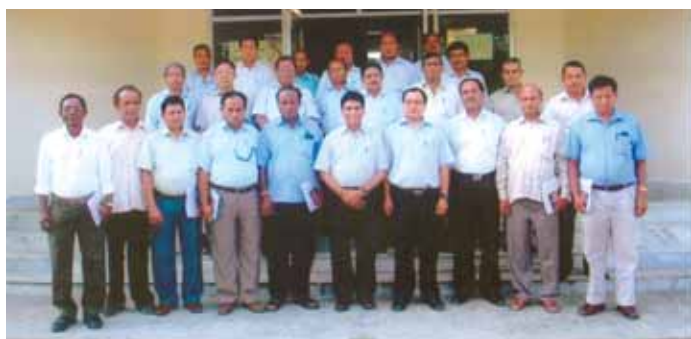
Program on Planning for a happy retirement life by SD Consulting held from 27th to 28th June, 2012 at ETDC, Duliajan