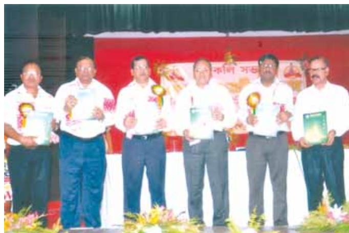
Shri SK Srivastava, CMD, OIL ceremoniously releasing the Souvenir during the IOWU Golden Jubilee Celebration