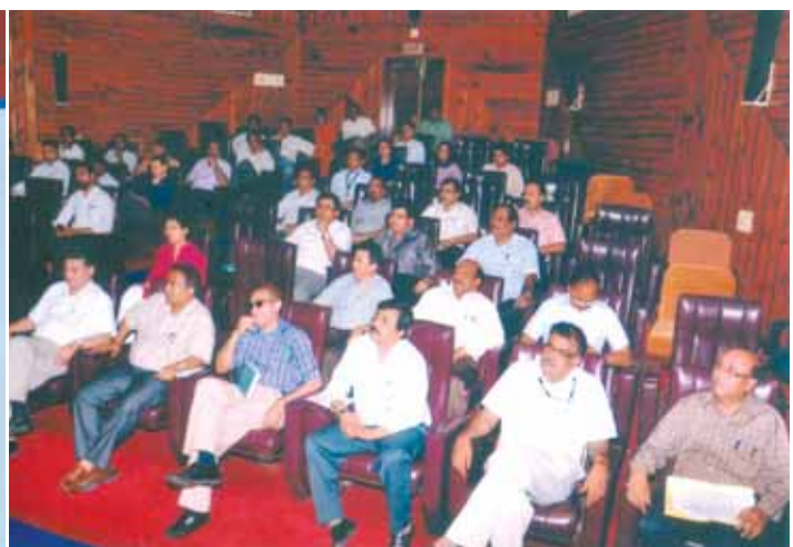
OIL officials attending the CSR workshop at MTDC