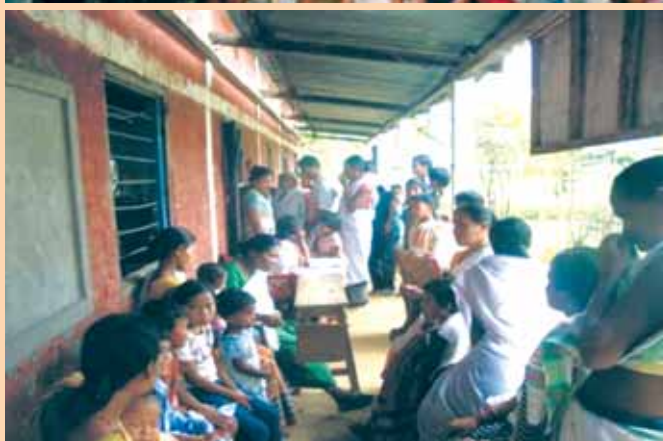
A few glimpses of the "MOBILE DISPENSARY CAMP" under project "HUSRUKHA" held at Kordoiguri village on 17.06.2012