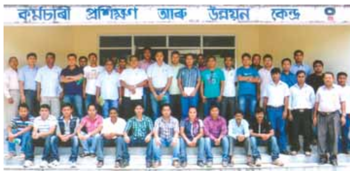
Program on MVT by Internal Trainer held from 2nd to 7th July, 2012 at ETDC, Duliajan