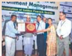
Page - 6