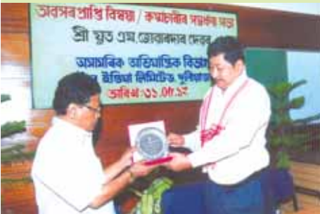
শ্ৰীএম জোৰাবাদৰ, অসামৰিক অভিযান্ত্ৰিক বিভাগ