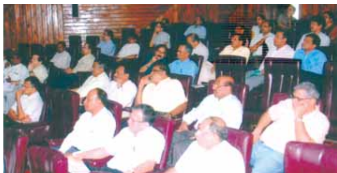
A Program on "Purchase Manual-2012" by Internal Trainer held on 28th June, 2012 at MTDC, Duliajan